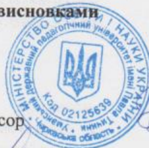
О. І. Безлюдний